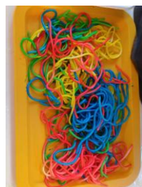
(8/1 1歳児 パスタ)