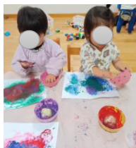
(5月27日野菜スタンプ)