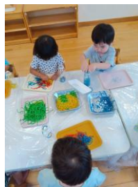
(7/23 1歳児 パスタ)