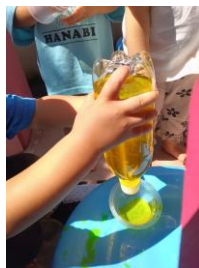
(9/1 1歳児 色水)