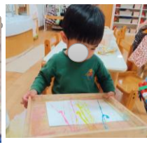
(4月14日ビー玉転がし絵)